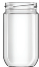
A 314 Ecova