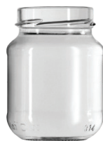
B 314 Ecova Boca Alta