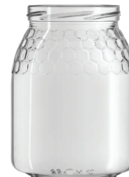
Mel STD 1 KG