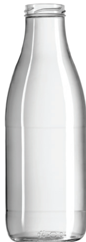
Zumo STD 1045